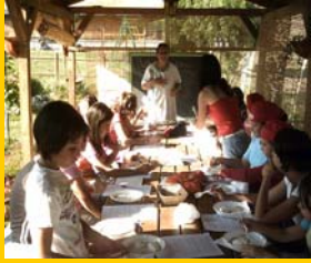
UNA GIORNATA DIDATTICA

Il nostro obiettivo e' creare un'occasione di contatto diretto tra il settore agricolo e la scuola per far conoscere l'origine del cibo e il lavoro dell'agricoltore o dell'allevatore, "custodi" delle ricchezze ambientali e culturali del territorio e della produzione di prodotti di qualità. Con il progetto "Fattorie Didattiche" facciamo conoscere ai bambini, e non solo, i vari aspetti della cultura agricola, tramite i "PERCORSI A TEMA" . Per i più grandi, invece, organizziamo, su prenotazione, dei veri e propri "STAGE AZIENDALI" . Questi sono rivolti ai ragazzi che desiderano, per vacanza, per curiosità, come prospettiva di lavoro, vivere l'azienda agricola.